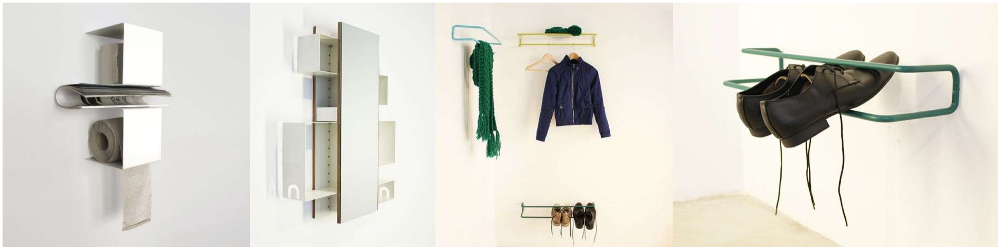
Ariane März + maerzgruen + Halle 3.1 + Abschluss 2011