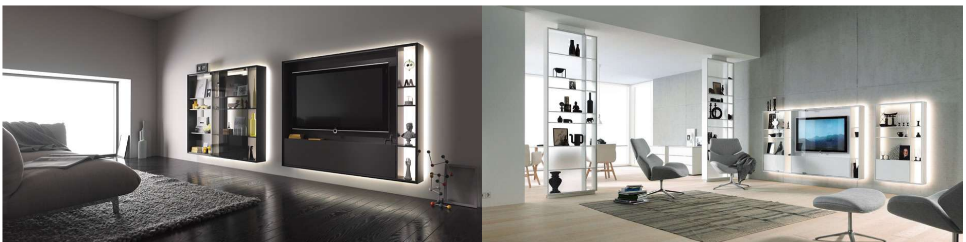
René Chyba + "BOOKLESS" für INTERLÜBKE + Halle 11.3 + Stand S20/T21 + Abschluss 2000