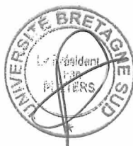
Président de l'UBS