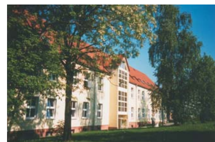
Hochschulcampus Scheffelstraße, Sitz der Wirtschaftswissenschaften

Mit der Gründung dieses nunmehr fünften Institutes - dem zweiten wirtschaftswissenschaftlichen - bündelt die Hochschule ihre Kompetenzen in Studium, Forschung und Lehre auf dem Gebiet der Betriebswirtschaft. Nach dem Einrichten der Institute für Kraftfahrzeugtechnik (IfK), für Produktionstechnik (IfP), für Oberflächentechnologien und Mikrosysteme (IfOM) und für Management und Information (IMI) geht die Hochschule damit einen weiteren Schritt, um ihr wissenschaftliches Profil in Technik, Wirtschaft, Lebensqualität für zukünftige Anforderungen zu schärfen.