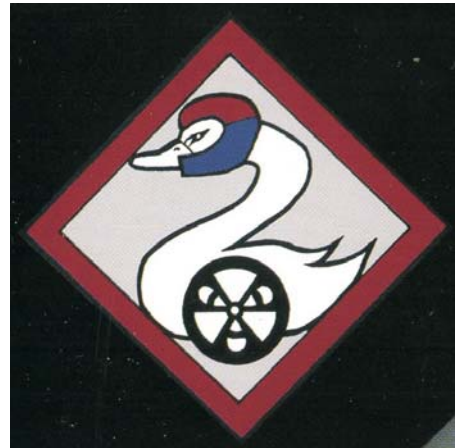
Logo des WHZ Racing Teams

Quelle und weitere Informationen/Programm: http://www.whz-racingteam.de