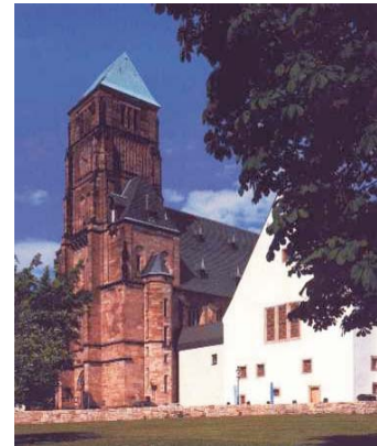
Schloßbergmuseum