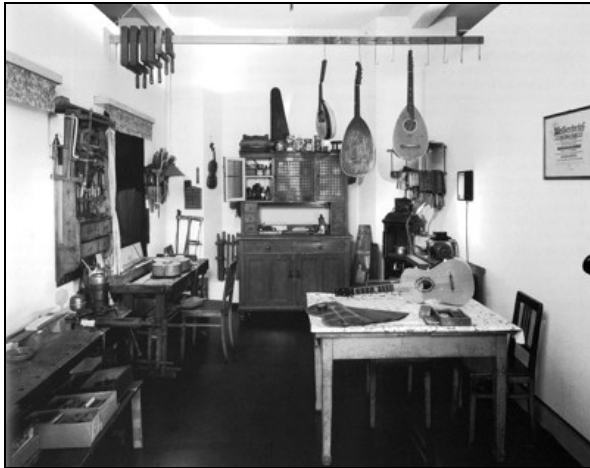
Werkstatt von Richard Jacob; Rekonstruktion der originalen Werkstatt (Markneukirchen, Goethestraße 2) in der Ausstellung des Museums für Musikinstrumente der Universität Leipzig

Gefördert wurde das Forschungsprojekt zunächst durch die Ostdeutsche Sparkassenstiftung im Freistaat Sachsen gemeinsam mit der Sparkasse Vogtland, in den letzten Jahren dann mit Mitteln des Bundesministeriums für Bildung und Forschung. Die Publikation und die CD kann über den Studiengang Musikinstrumentenbau bezogen werden.