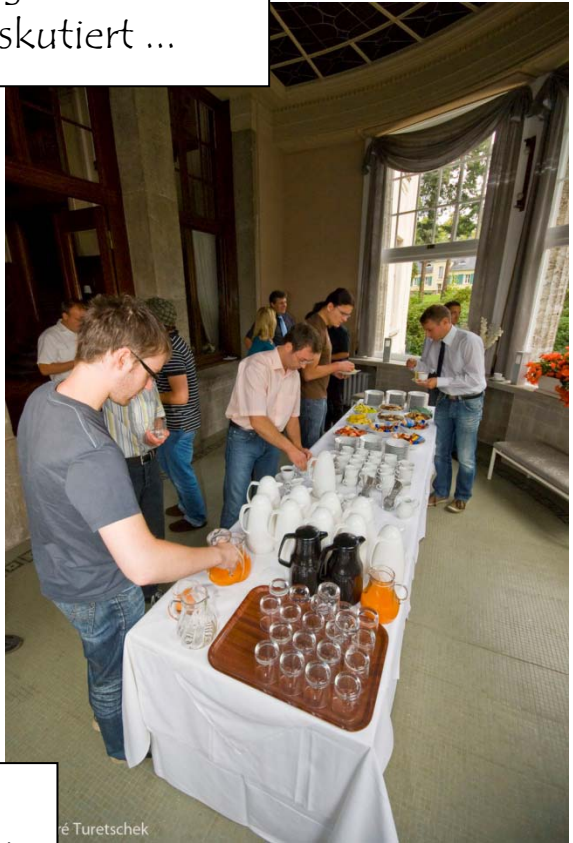
... und neue Ideen präsentiert.