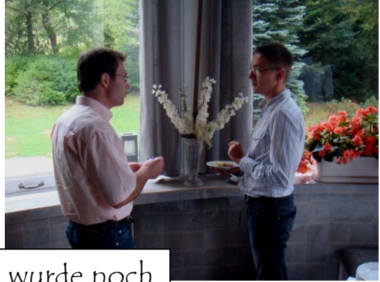
Am nächsten Tag wurde noch intensiver diskutiert ...