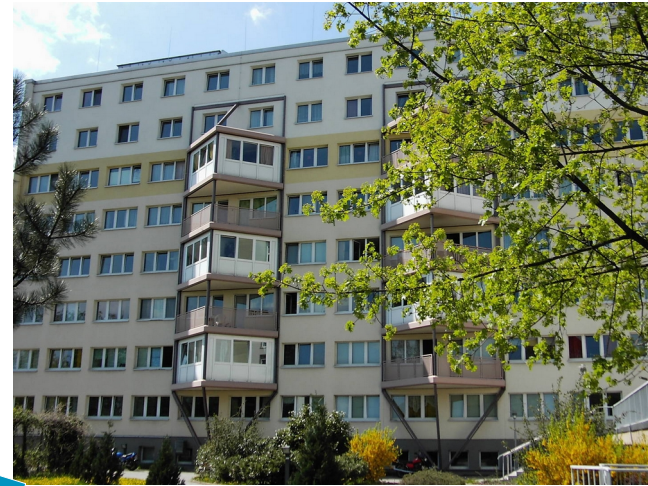
Standort Zwickau Innere Schneeberger Str.