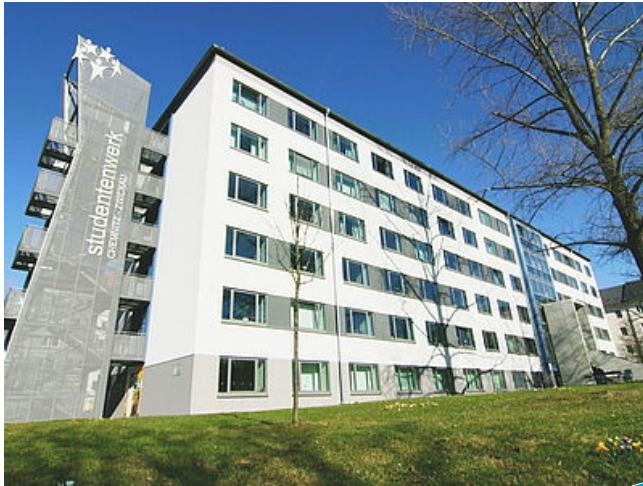
Standort Chemnitz Thüringer Weg 3

Wir unterstützen Studierende der Technischen Universität Chemnitz und der Westsächsischen Hochschule Zwickau mit wirtschaftlichen, sozialen und kulturellen Dienstleistungen.